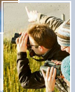
Zugvögel stehen bei allen Veranstaltungen im Mittelpunkt.