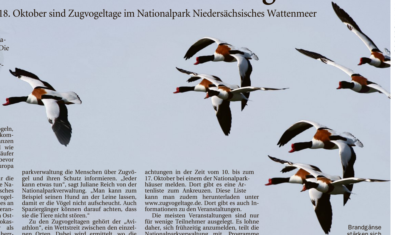
Brandgänse stärken sich auf ihrer Reise in den Süden oft im Wattenmeer.

Die meisten Veranstaltungen sind nur für wenige Teilnehmer ausgelegt. Es lohnt daher, sich frühzeitig anzumelden, teilt die Nationalparkverwaltung mit. Programme gibt es bei den Nationalparkhäusern und vielen Tourist-Informationen. Mehr Informationen, auch zur Anmeldung, gibt es unter Telefon 04421 / 91 10.